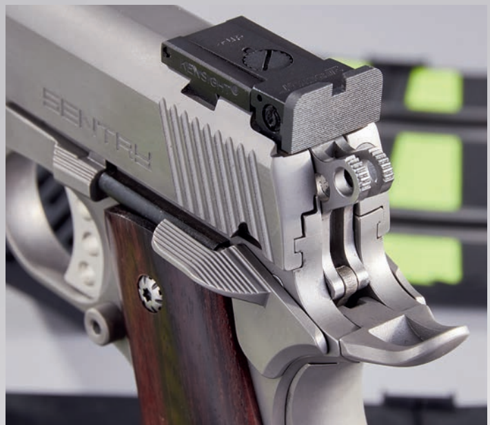
Sportliche Baugruppen: Neben einer voll einstellbaren Kensight-Kimme verbaut STP ein High-Grip-Beavertail und einen Doug-Koenig-Hammer.