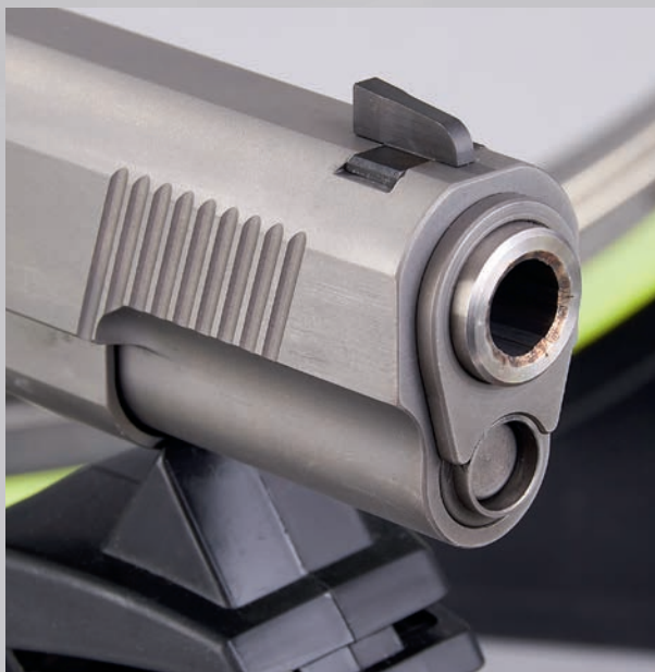
Wie bei einer klassischen 1911er kommt auch bei der STP Sentry eine Bushing-Führung des Laufs zum Einsatz.

dersystem bei: Eine lange, einteilige Führungsstange, auf der die Feder sitzt und eine offene Buchse, welche die Stange im Schuss führt. Das System sorgt für eine sehr spielarme Führung und auch Abstützung des Laufs, ist aber eben etwas schwierig im Zusammenbau. So muss man die Verschlussfeder beim Zusammensetzen der Waffe mittels einer Büroklammer (oder Ähnlichem) fixieren, um die Einheit wieder in den Verschluss einzusetzen. Auch die restliche Ausstattung der Pistole zielt auf Sport und offenbart hochwertige Komponenten. So vertraut die Sentry auf eine voll einstellbare Kensight-Kimme mit geriffeltem Blatt und Rechteckausschnitt samt breitem Target-Korn. Der 6-Feld-Zug-Matchlauf kommt vom US-Spezialisten KKM Precision. Außerdem wartet die Sentry mit einem High Grip-Beavertail, einem skelettierten Alu-Abzug mit Triggerstop und einem Low-Mass-Hahn nach Doug-Koenig-Art auf. Auch kleine Details an und um die Sentry stimmen: So kommen verzierte Torx-Schrauben zur Befestigung der Holzgriffschalen