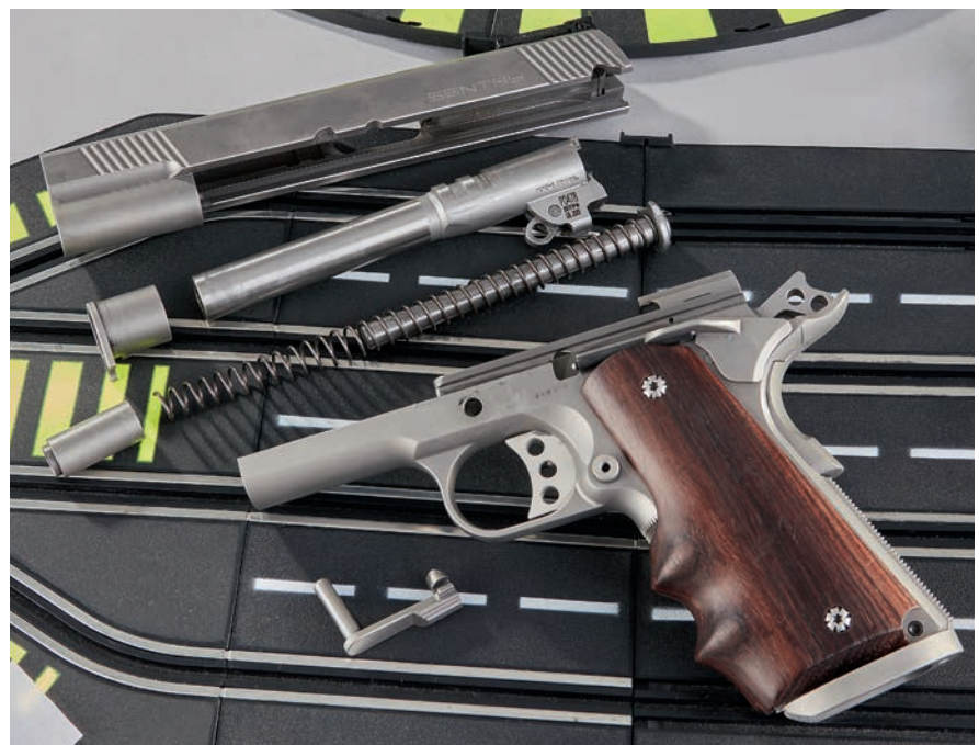
Die Sentry zerlegt in ihre Hauptbaugruppen (v. o.): Verschluss, Bushing und Lauf, Buchse, Schließfeder samt Führungstange, Griffstück und der Verschlussfanghebel.

des Schussverhaltens gibt es nur Positives zu berichten. Die Waffe liegt relativ neutral in der Hand, der Rückstoßimpuls mit den Fabrikpatronen ist eher schwach. Die Visierung und der Abzug passen sehr gut für statische Großkaliber-Disziplinen. Einziger kleiner Kritikpunkt bleibt das bereits oben erwähnte minimale Kriechen des Züngels vor dem Brechen. Die restliche Charakteristik und das Abzugsgewicht sind indes top. Die Sentry arbeitete zu 100 Prozent störungsfrei.